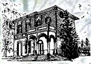
Pro Loco Tradate APS