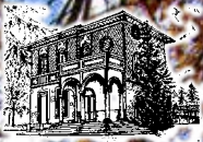
Pro Loco Tradate APS